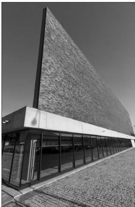
Budova Velkého světa techniky.

Také se vám zdá, že slunečné dny nebývalé teplé zimy i paprsky zalitý příchod jara prosvětlyly celé Vítkovice a že s nimi ožily i ulice obvodu? Věřím, že s jarem začne stoupat i počet návštěvníků naší části Ostravy, která má lidem opravdu co nabídnout. A to nehovořím jen o puncu historie, který Vítkovice mají, ale také o pestré současnosti. Stačí se jen podívat na ulici Výstavní. Teplé počasí přivedlo do sadu Jožky Jabůrkové více dětí, ožila i populární lezecká věž. V nedaleké blízkosti je oblíbená cukrárna, jejíž dobré jméno už dávno překročilo hranice obvodu, turisté i místní zde naleznou i příjemné restaurace. Ty ostatně jsou i v jiných lokalitách obvodu. Máme tady špičkový stadion, v ulici U Cementárny začala stavba nového sportovního areálu. To všechno jsou střípky, z nichž se skládá celistvá mozaika, která k Vítkovicím přitahuje pozornost okolí.